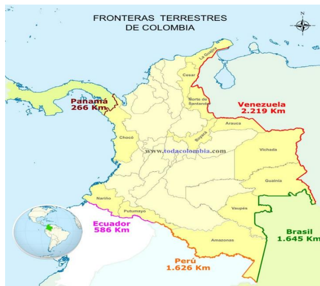
Imagen N° 2. Mapa fronteras terrestres de Colombia

La provincia ecuatoriana del Carchi, de la cual, como se ha mencionado Tulcán es su capital, así como el resto del país ecuatoriano, ha tenido en los últimos años una constante migratoria de los demás países de la región, según el portal DatosMacro.com, aunque en el año 2019 disminuyó el número de inmigrantes hacia el país, con relación a los años anteriores, se citan datos de la Organización de las Naciones Unidas (ONU), que dan cuenta de un total de 381.507 de inmigrantes, lo que supone un 2,21% de la población de Ecuador. La siguiente tabla da cuenta el número de migrantes que ha entrado al país en los años 2010, 2015, 2017 y 2019, según el sexo.