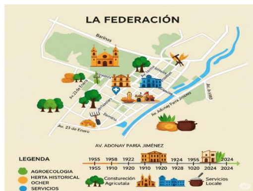
Figura 2. Modelo de Ruta Turística Agroecológica del Barrio La Federación