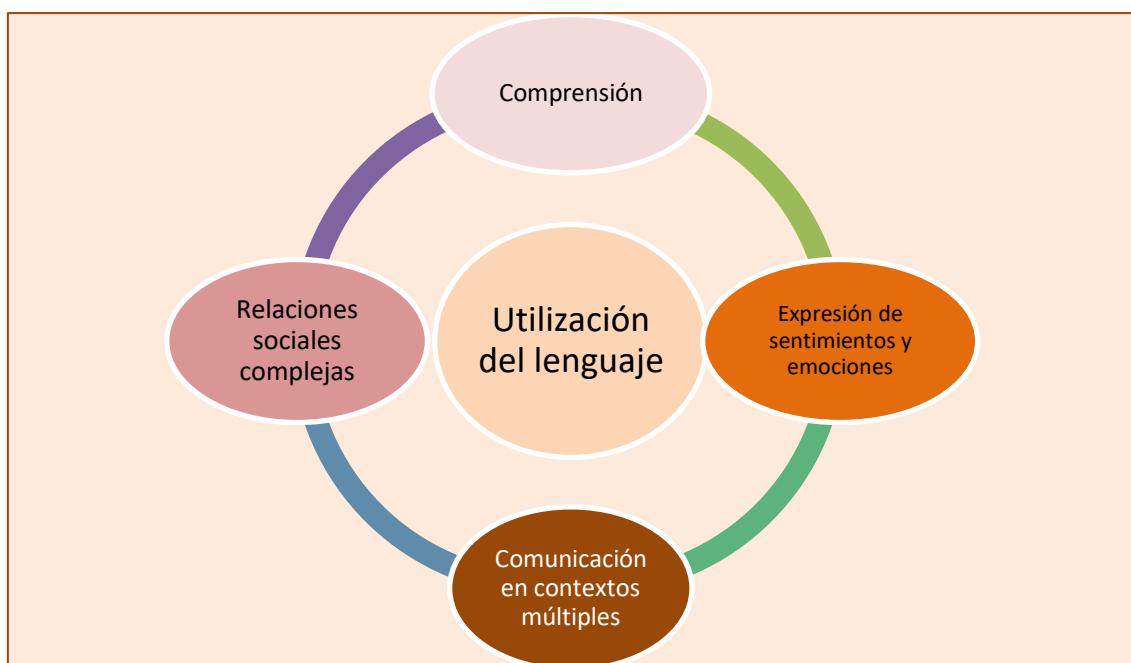
Figura 4. Área de formación personal social y comunicación

La figura 4 representa el área de formación personal social y comunicación la cual comprende aspectos importantes del desarrollo de la personalidad del niño y la niña entre las cuales cabe mencionar: comunicación en contextos múltiples, relaciones interpersonales complejas, comprensión y fundamentalmente la expresión de sentimientos y emociones de manera libre y espontánea.