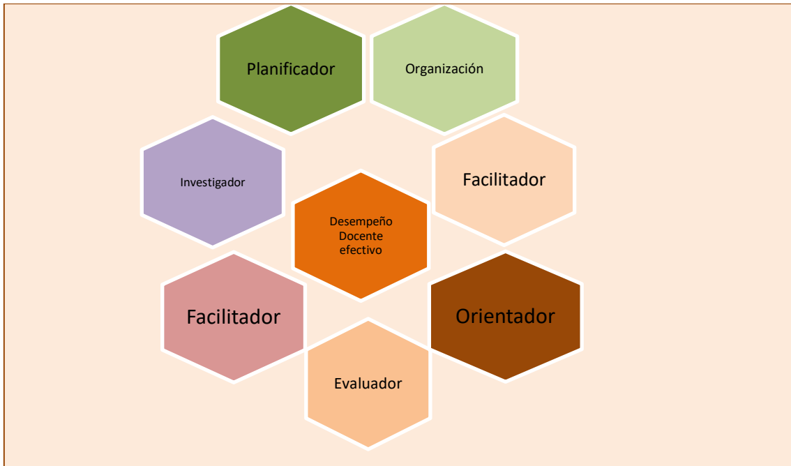
Figura 2. Desempeño Docente Efectivo

La figura 1 representa las diferentes acciones que debe desarrollar el docente para lograr las metas y garantizar la calidad educativa a través del desempeño de funciones en su praxis pedagógica cotidiana.