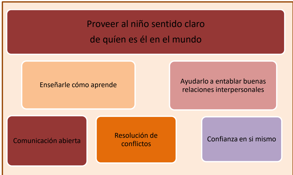
Figura 3. Apoyo socioemocional del estudiante

En la figura 3 están representados las competencias que debe tener en su perfil el docente para apoyar socioemocionalmente al estudiante, entre las que se destacan: ayudar al niño a comunicarse de manera abierta y efectiva, promover las buenas relaciones interpersonales, brindarle herramientas par la resolución de conflictos, orientarlo para que el niño y la niña logren adquirir confianza en si mismo de manera que puedan lograr sus metas.